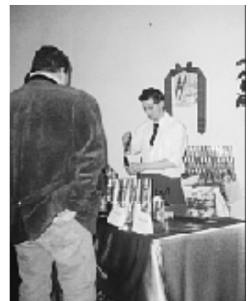
Miešaný „Červený netopier“.

Prípravka tanečného odboru ZUŠ v Nižnej je úspešným pokračovateľom a ľahňou talentov pre už známych Hopcupákov a Chrobákov. Ich tanečná prvotina je „Španielsky tanec“.