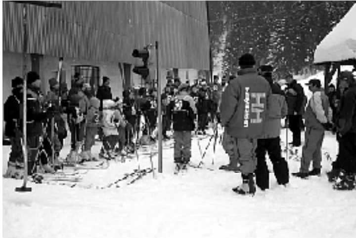
Slávnostný nástup pretekárov pred začiatkom pretekov.

obsluhy myšlienku na zorganizovanie lyžiarskych pretekov. Preteky v slalome