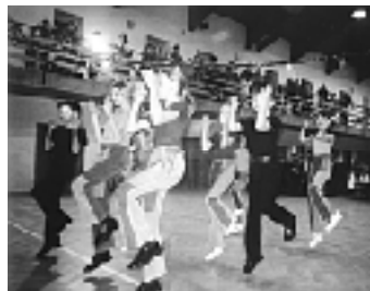
Na tanečnom parkete sú Chrobáci

energetický drink RED BAT. Hodnotné ceny v tombole, ktoré venovalo množstvo prispievateľov a sponzorov taktiež prispelo k výbornej náde plesajúcich. Hudba v sále znela až do skorých ranných hodín a poslední návštevníci tak odchádzali zo sály už takmer na svitaní. (dokončenie na str. 3)