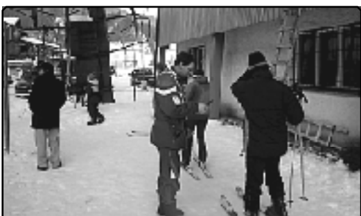
V sobotu 30. januára asistoval pri kontrole lístkov aj starosta obce.

možnosti vyšantiť sa na klziskách, v bežeckej stope, alebo na svahoch lyžiarskych vlekov. Po jesennej oprave kotiev a spevnením snehovej vrstvy na svahu pomocou ratraku sa aj v Podbieli