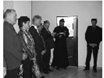
S vôňou čerstvej omietky sa miešala vôňa kadiidla