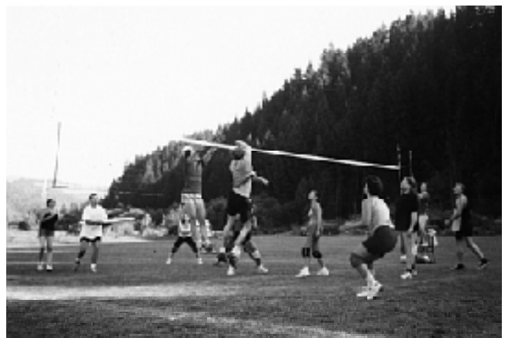
Ilustračná fotografia je z exhibičného zápasu volejbalistov v rámci osláv 75. výročia vzniku TJ ŠK Podbiel