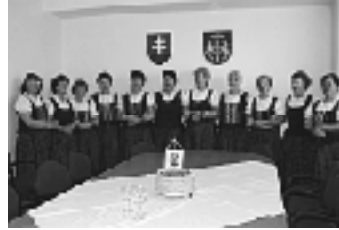
Senková v novej zasadačke Obecného úradu.

„Na Orave dobre“. Mikuláš ich obdaroval sladkými lízatkami, slávnostne odomkol dvere a odovzdal kľúč od vynoveného úradu starostovi obce. V tom sa ozval zo zasadačky spev žien zo ženskej speváckej skupiny Senková. Všetci pozvaní hostia,