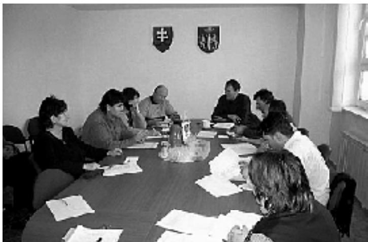
Fotografia Pavla Dubovského zachytáva atmosféru rokovania zastupiteľstva v novej zasadačke OcÚ.

Prvé tohoročné verejné Obecné zastupiteľstvo sa v zasadačke zrekonštruovaného Obecného úradu uskutočnilo vo štvrtok 22. januára. Na programe bola správa auditora, prerokovanie plnenia rozpočtu za uplynulý rok, zmeny znenia všeobecných záväzných nariadení (VZN), prerokovanie žiadostí občanov a najdôležitejším bodom bolo prerokovanie rozpočtu na rok 2004. Každý z poslancov sa snažil