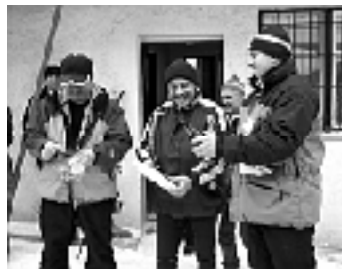
Druhá najkrajšia kategória - „zlatých 100“.