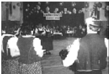
Senková na piatom plese obce Podbiel

Prešlo celých štyridsať dní a tentokrát sa zaplnila veľká sála kultúrno-spoločenskej haly, návštevníkmi jubilejného, piateho reprezentačného plesu obce Podbiel. Príchodých vítalo v sále netradičné rozloženie stolov a malého pódia pre muzikantov. Hoci v stred týždňa pred plesom to vyzeralo na nejakých stoosemdesiat ľudí, na plese ich nakoniec v sále sedelo takmer dvestošesťdesiat. Po slávnostnom otvorení plesu starostom obce zaspievali