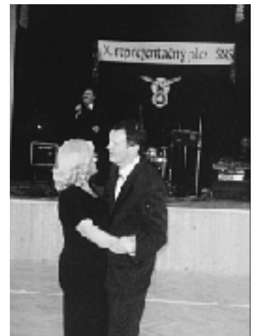
Prvý tanečný pár po ukončení programu - starosta obce s manželkou.