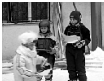
Podbielanské lyžiarske nádeje po prevzatí ocenení.