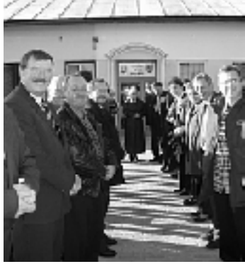
Príchod Mikuláša vítali všetci prítomní so širokým úsmevom

ňanie zvončeka. To ešte prítomní hostia netušili, že deduško Mikuláš sa nechystá do škôlky, alebo Základnej školy, ale smeruje práve pred Obecný úrad, kde už všetci stáli nastúpení v „špalieň“. Až keď Mikuláš prechádzal pomedzi nich, pochopili, na čo vlastne do tej chvíle čakali a čo