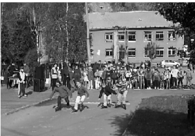
Na svojej strane prišli aj korčuľari.

Ten deň bol pre nás trochu iný než tie ostatné. Bol to piatok 15. októbra, kedy sa uskutočnil Deň starostu. Pre našich školákov to znamenalo dopoludnie plné súťaží, hier a radosti. Obecný úrad v spolupráci s vedením ZŠ s MŠ pripravil súťaže, v ktorých si mohli zmerať sily v pretekoch na koľobečkách a koľieskových korčuľiach. Tí najlepší sa samozrejme dostali na "stupne víťazov" (korčuľari radšej po sediačky), no ani ostatní neobišli naprázdno. Každý dostal sladkú odmenu, za čo patrí vďaka organizátorom - Obecnému úradu a starostovi našej obce.