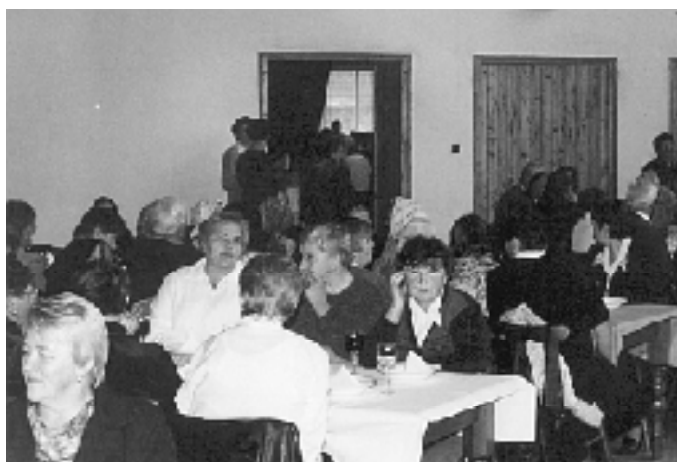
Pohľad do radov podbielanských dôchodcov.