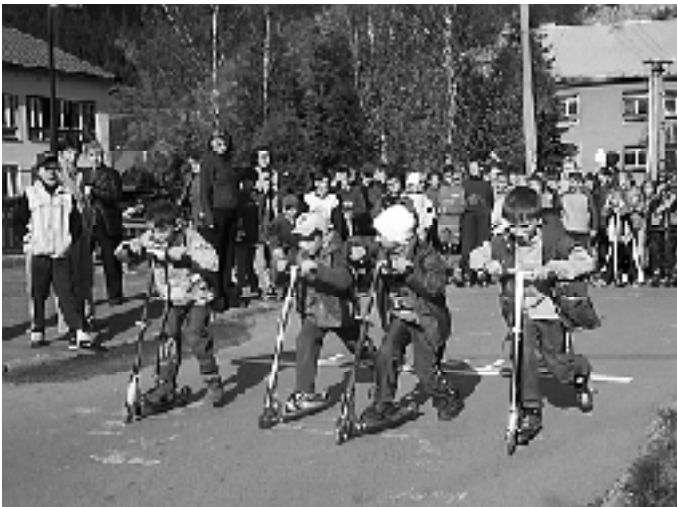
"..tri, dva, jedna, štart!" a prví pretekári sú už na trati. Všetci ostatní netrpezlivo čakali na svoju šancu.