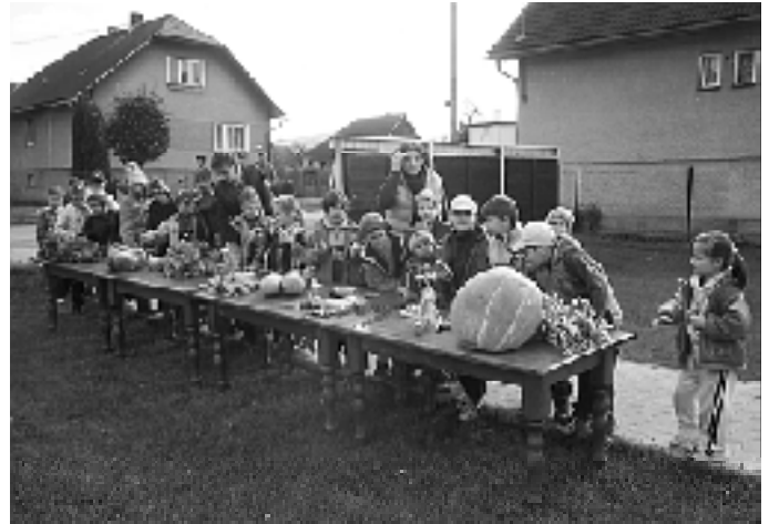
Zaujala aj výstavka dospelého ovocia a zeleniny.