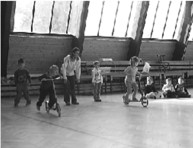
Aj napriek tomu, že v hale bojovali tí najmenší, nasadenie bolo obrovské.