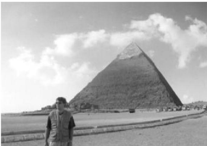
Chefrenova pyramída v Gíze