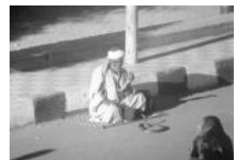
Egyptan s kobrami