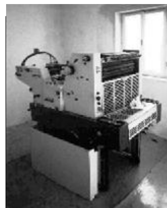
Toto je stroj, na ktorom sa tlačia obecné noviny. Pochádza z bývalej nižnianskej Tesly a do Podbiela sa dostal zásluhou OVP Orava s.r.o., ktorá ho v tomto roku kúpila.