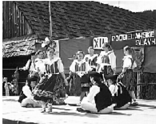
Zahaničný hosť tohoročných slávností - folklórny súbor Li Tchena z Belgicka

Na začiatku bola slávnostná odpustová svätá omša, po ktorej bezprostredne nasledovalo vysvätenie novej kaplnky stojacej