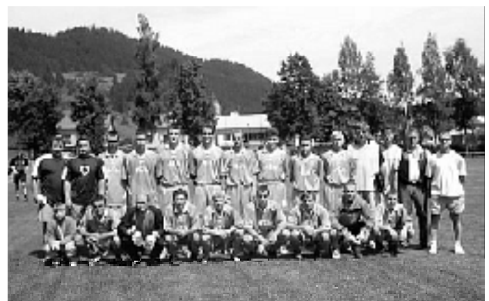
Vítaz 37. ročníka Memoriálu Družstevník Turč. Štiavnica -PAD-