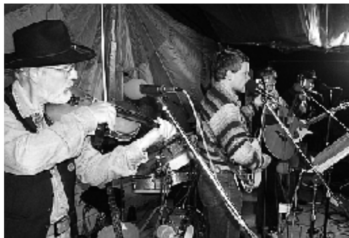
Slovenská country "klasika" v podaní Jazdcov z Banskej Bystrice...

text: Ľubomír Jarolín