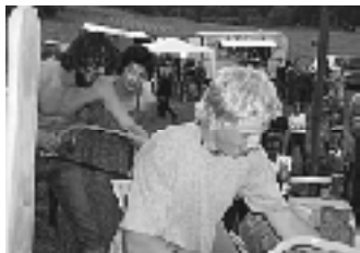
Finále v pílení metrovice.

rúbaní napílených klátov. V týchto "si lových" disciplínach bolo vidieť, že súťažiaci saveu musdi aj poriadne zapotiť, aby pokorili pripravené kláty. Hoci pôvodne avizovanú súťaž v pretláčaní rukou sa nepodarilo realizovať, diváci sa pobavili pri ďalšej disciplíne, ktorou bolo pitie piva slamkou. Súťažné disciplíny a vstupy muzikantov odštartovali na