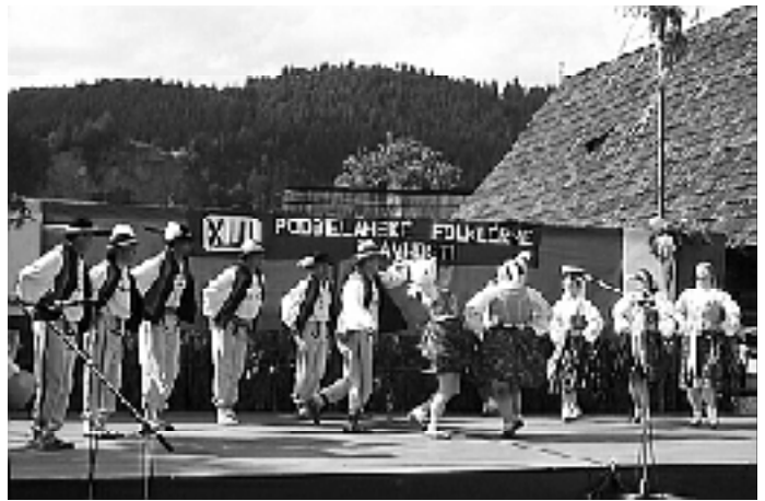
Oravan SENIOR s mnohým dobre známym a obľúbeným tancom "Hej, gordecki jalom".