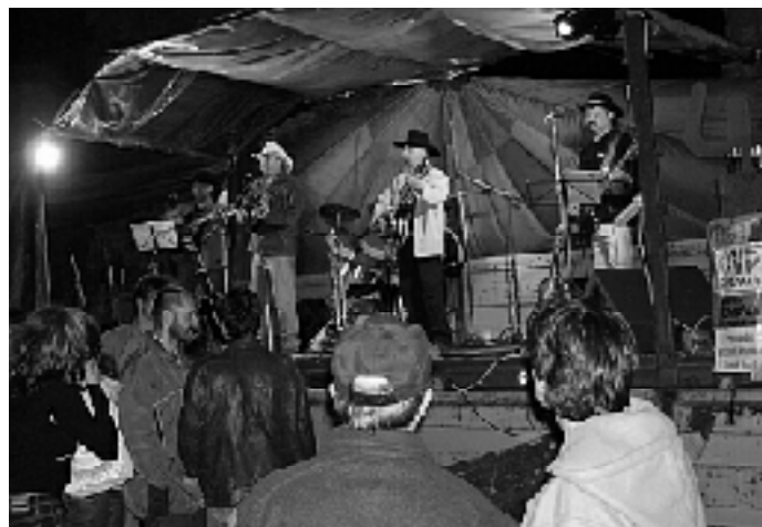
... a finále TAVBY 2004 v podaní skupiny Kredenc